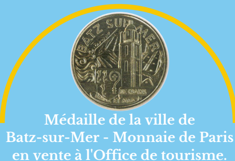
Médaille de la ville de Batz-sur-Mer - Monnaie de Paris en vente à l'Office de tourisme.