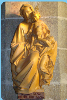
Notre-Dame du Précieux Sang (1979, 1,20m, bois d'Avodiré)

Dans l'église Saint-Guérolé, place du Garnal: