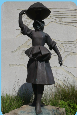
La Porteresse, devant un bas relief représentant les marais salants, à l'angle du Musée intercommunal des Marais Salants (1983, 2,30m, bronze)

Dans l'église Saint-Guérolé, place du Garnal: