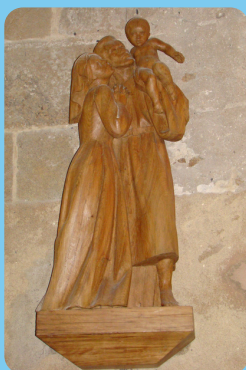
La Sainte Famille (1994, 1,20m, chêne)