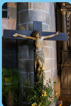
Christ en croix (1958, 1,10m, chêne polychrome)